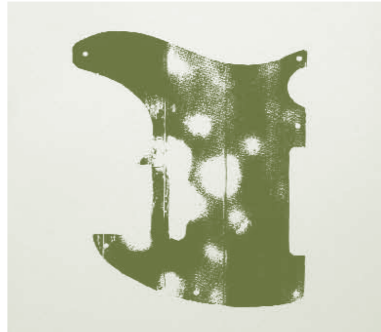
Telecaster , 2005, Holzgravuren / woodcuts, 50 x 33 cm Elf Holzgravuren auf Vélín d'Arches Papier, pures Chiffon, 200 g, Auflage 25 / Eleven woodcuts on paper Vélín d'Arches, pure chiffon, 200 g, Edition 25.

The emphasis of his work is on sculpture. The world of oversized figures created mainly from synthetic resin or polystyrene is in line with an art-historical tradition based on pop art. But Kohler's figures breathe a different aesthetics. They never appear obtrusive or flashy, but win over the observer by their mysterious and internalised aura. The works shown in the exhibition, Hibou , Souche , and Teufelstein , are an accumulation of cheerful, bizarre and mysterious apparitions.