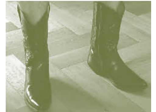
Clapping music santiago interpretation , 2006, DVD, 4:12 min. Nach Steve Reichs Komposition / After Steve Reich's composition Clapping Music , 1972, zusammen mit/together with Gilles Dupuis.

In der Videoarbeit Clapping music santiago interpretation , 2006, bezieht sich Kohler auf das Minimal Stück Clapping Music aus dem Jahr 1972 des Komponisten Steve Reich. Die Kamera fokussiert dabei nur einen Bildausschnitt: Zu sehen ist nur ein Paar Cowboystiefel, das rhythmisch auf den hölzernen Boden klopft. Erst bei genauem Hinsehen wird deutlich, dass das dargestellte Stiefelpaar zu zwei verschiedenen Personen gehört. Auch hier geht es Kohler darum, ungezwungen und frisch auf die Welt zuzugehen. Die Eindrücke, die er damit vermittelt, sind immer wieder überraschend und unerwartet. Sein Bildreservoir sprengt die kühnsten Vorstellungen und verzaubert den Alltag.