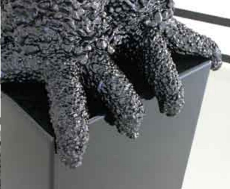
Linke Seite /left side: Nevin Aladag / open / closed, 2006, Edelstahl, Motor, rotierendes Drehschild / premium steel, motor, rotating panel. Aus der Serie Absatz / from the serie Stiletto: Detail aus / detail from: Hotel / room 4 am 3:05 min., 2006, getanzte Prägung durch Stiletto auf Papier / danced impressions from stiletto on paper, 70 cm x 70 cm. Voice Over (Video still), 2006, Video, 14 min. Rechte Seite /right side: Vincent Kohler / Sauche, 2006, Kunstharz, LED, Elektronik / artificial resin, LED, electronic, 45 x 100 x 140 cm. Hibou, 2006, Styropor, Kunstharz, Elektromotor, Elektronik / polystyrene, artificial resin, motor, electronic, 195 x 55 x 40 cm.