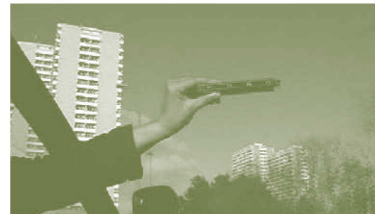
Voice Over (Video still), 2006, Video, 14 min.

Die Untersuchungen von kollektiven Erfahrungen überprüft die Künstlerin mit individuellen Erfahrungen und Selbstverortung. Sie tut dies in gesteigerter Form, wobei physische Verausgabung die Intensität multipliziert. Eindrücklich zeigt dies die Serie von