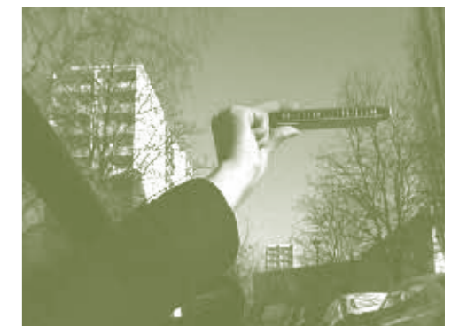
Voice Over (Video still), 2006, Video, 14 min.

The artist reviews the explorations of collective experience with individual experience and self-discovery. She increasingly indulges in it, while physical exhaustion multiplies the intensity. This is impressively shown in the series of drawings, Stiletto, Danced Song Selection from 2006, in which concentration and physical commitment are predetermined by the length of the musical piece. The drawings show